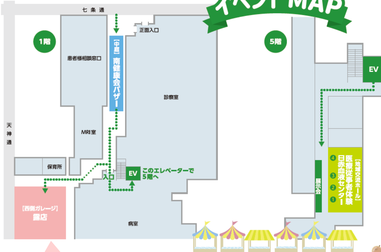
【西側ガレージ】露店拡大図